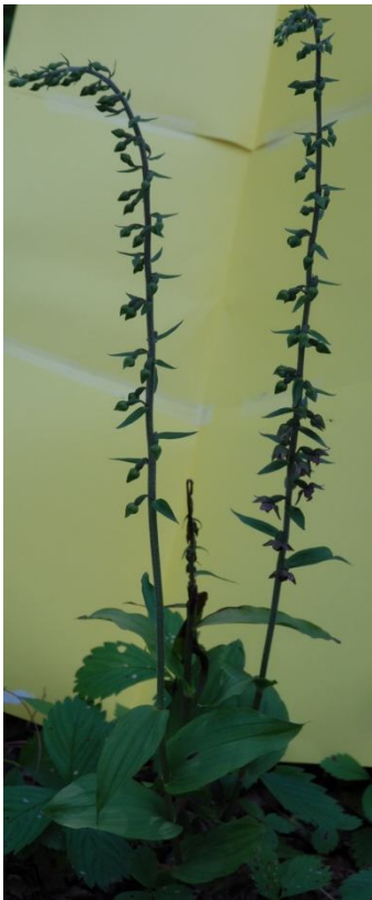
Plante entière devant un écran