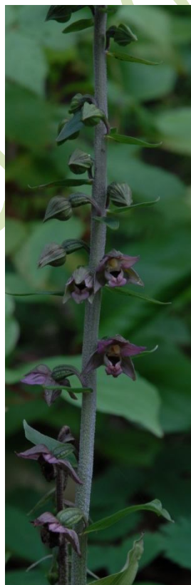
Tige avec boutons floraux et fleurs