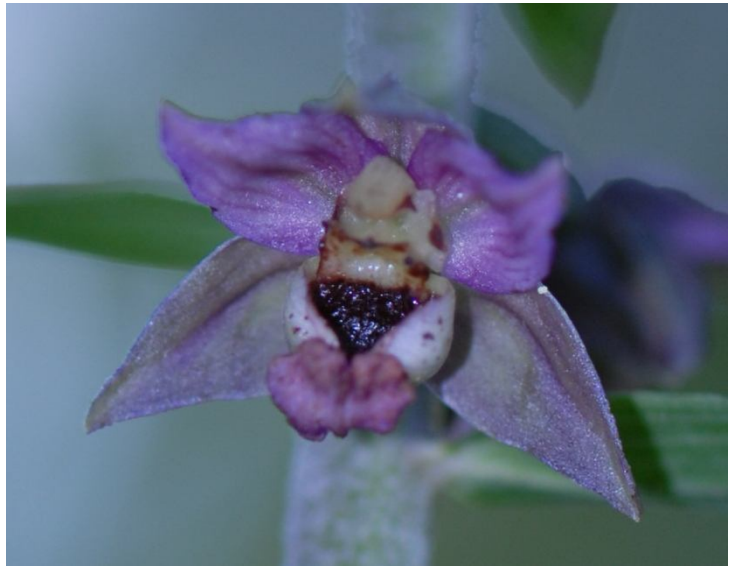
Gros plan de la fleur

L'épipactis petit-hellébore provient d'Europe où elle pousse dans les bois. Elle a probablement été apportée en Amérique parce qu'on croyait qu'elle avait des propriétés médicinales. Elle a été découverte dans la nature en premier dans l'état de New York. Selon le frère Marie-Victorin, elle était rendue à Montréal en 1893 et à Québec au début du 20e siècle.